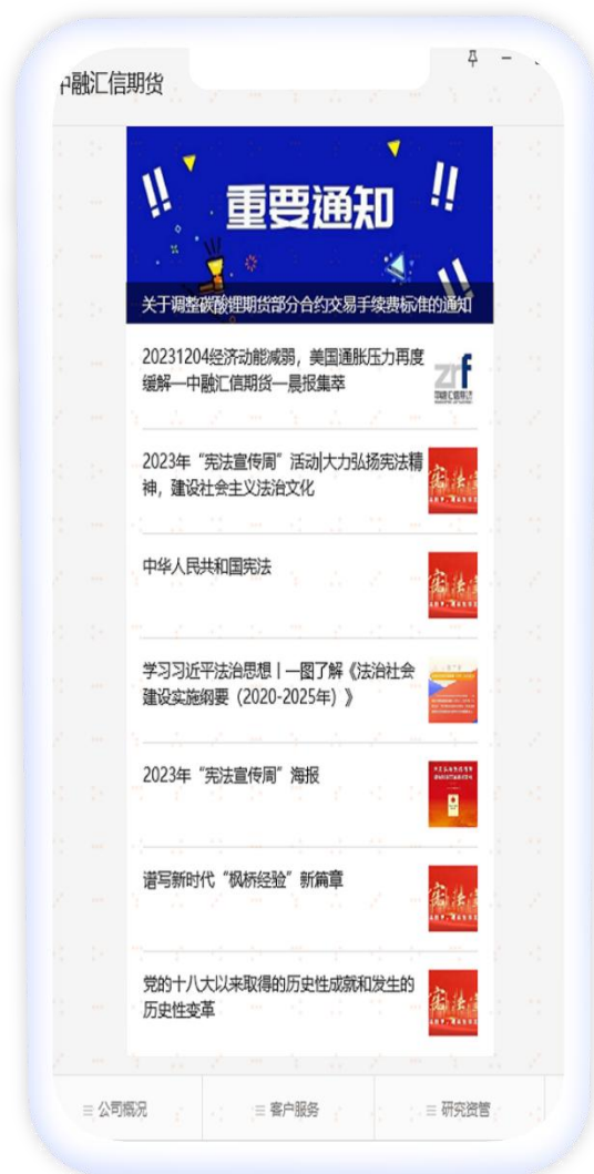
图 7：微信公众号宣传

为增强活动效果、扩大宣传范围，公司员工还走上街头、走进商圈，通过悬挂横幅和向广大群众派发宣传材料的方式开展宣传，深化公众对宪法精神的理解和认同，让宪法精神真正深入人心，成为全社会共同的价值追求和行为准则。