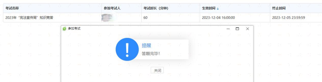
图 4： 宪法知识竞答情况

了宪法意识和法治素养，深化了对宪法精神的理解和体会，进一步激发了大家学习宪法的热情和动力，做到自觉维护宪法权威，为构建社会主义和谐社会营造了良好的法治氛围。