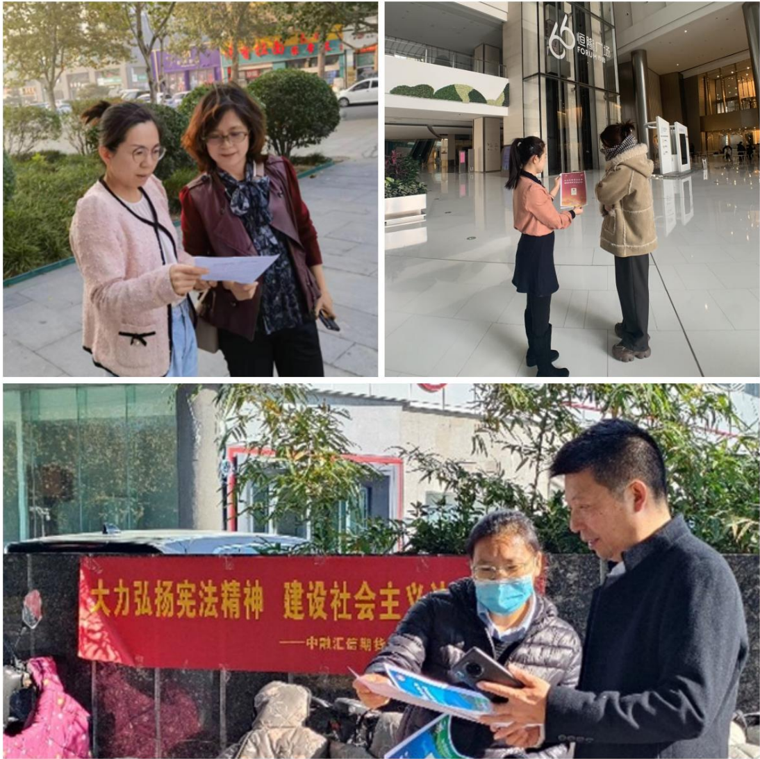
图 8：走上街头、走进商圈宣传